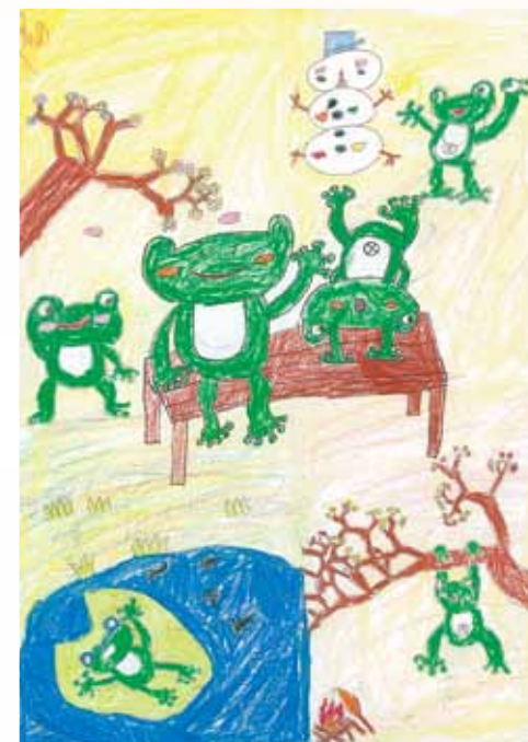
絵 / 山中 太暉 (8歳)